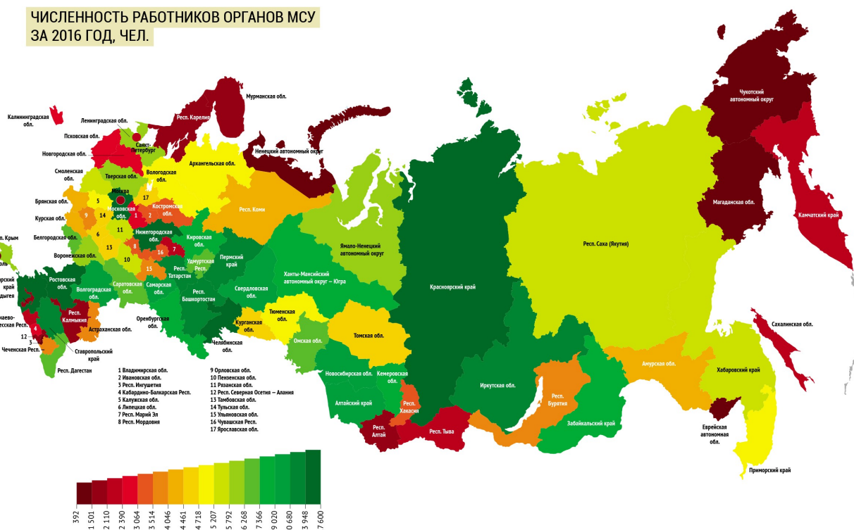
ЧИСЛЕННОСТЬ РАБОТНИКОВ ОРГАНОВ МСУ ЗА 2016 ГОД, ЧЕЛ.