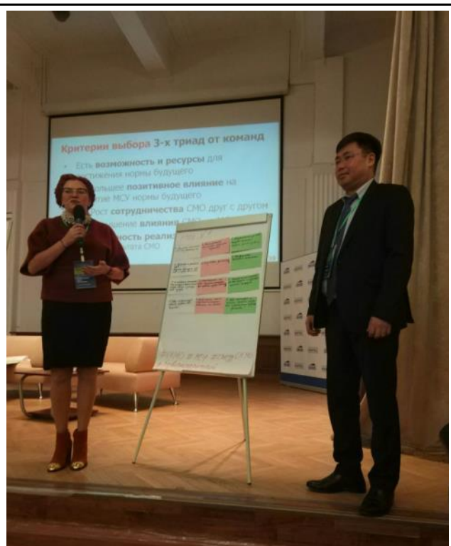
Выступления команд по отобранным триадам

Ниже приводится выбранный при голосовании всеми участниками сессии список из семи наиболее актуальных триад для разработки мер по достижению желаемого будущего.