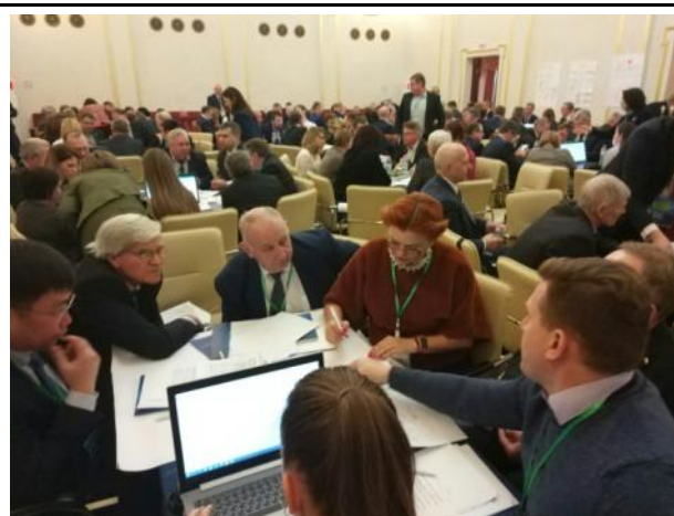
Рассадка по столам и рабочая атмосфера.