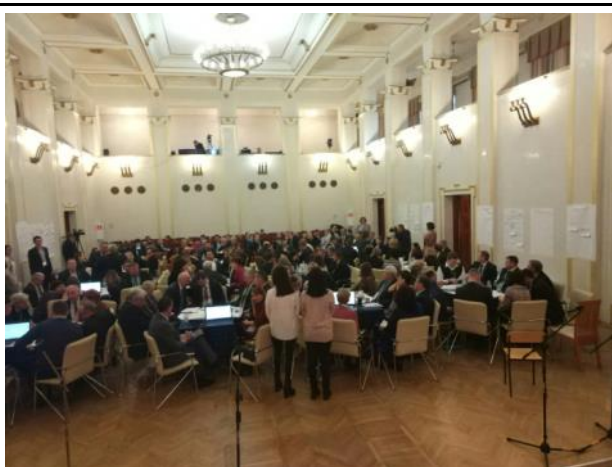
Общий план, вид зала со сцены.