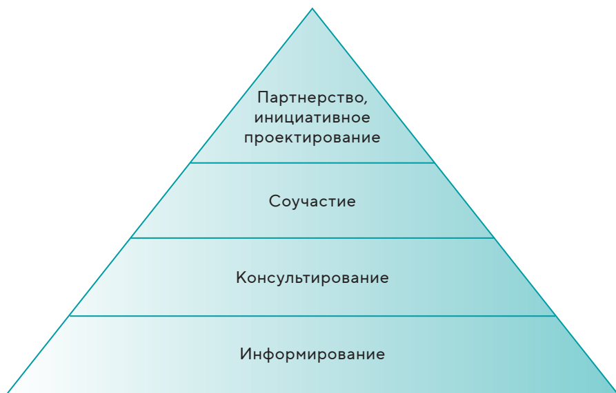
Рис. 2. Уровни вовлечения участников развития городской среды

Авторами методических рекомендаций Минстроя России выделены пять уровней вовлечения: информирование, консультирование, соучастие, партнерство, инициативное проектирование. Наглядно их иерархия изображена на рис. 2.