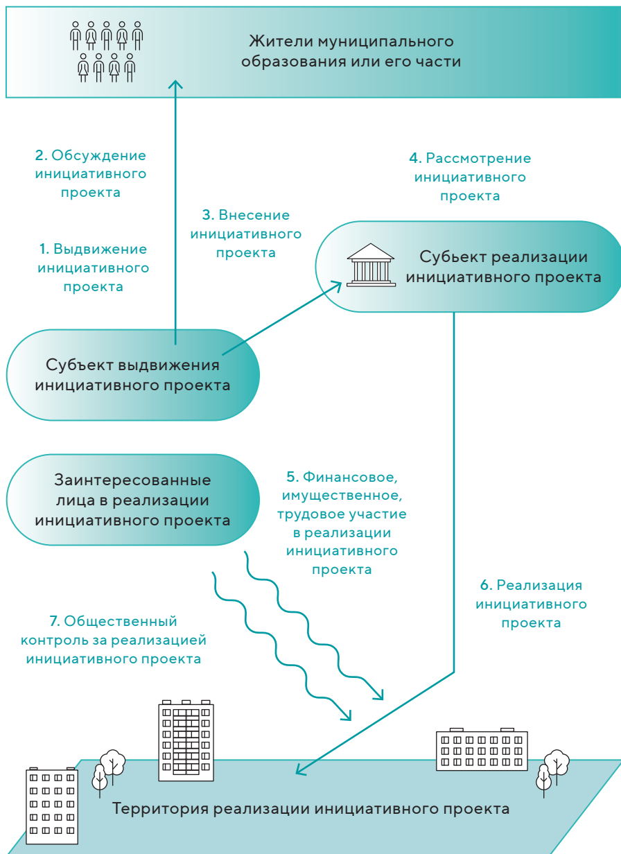
Рис 1. Общая схема реализации проектов инициативного бюджетирования