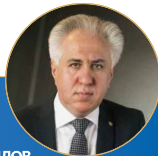
Рашид ИСМАИЛОВ, председатель Российского экологического общества:

Соответствующий закон на пленарном заседании 18 декабря одобрила Государственная Дума РФ. Муниципальная власть теперь напрямую отвечает за все, что связано с зелеными зонами, управлением отходами в пределах установленных норм, благоустройством и охраной местных водоемов. Муниципалитеты смогут самостоятельно организовывать субботники, акции по озеленению и мероприятия по экопросвещению.